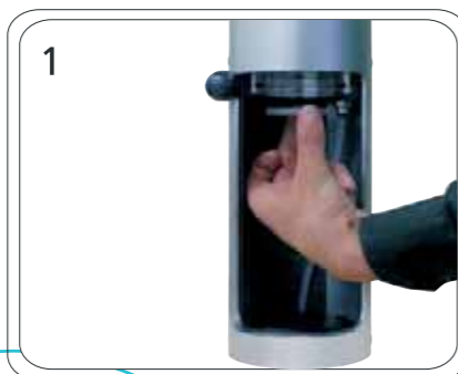
Maszyna do napełniania puszek spray F1