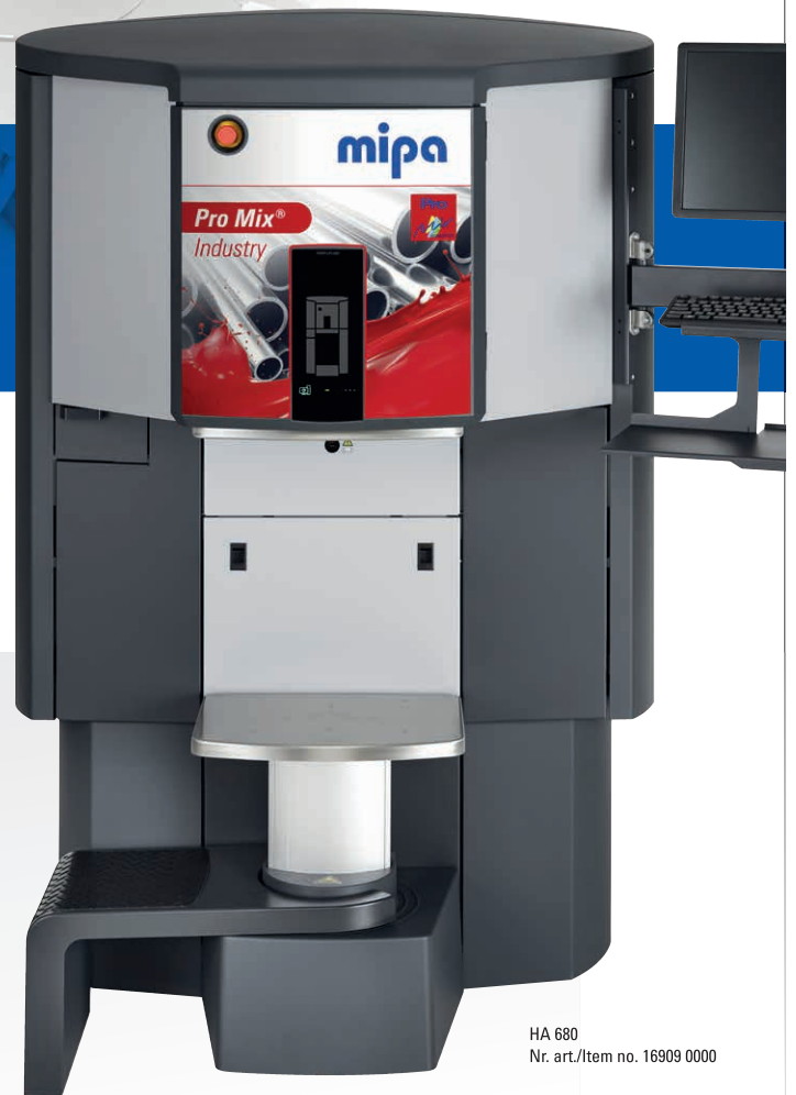
HA 680 Nr. art./Item no. 16909 0000

Inne maszyny, automaty do barwienia i akcesoria można znaleźć w naszym aktualnym cenniku maszyn. Further Machines, Tinting Dispenser and Accessories see our current Machine Price list.